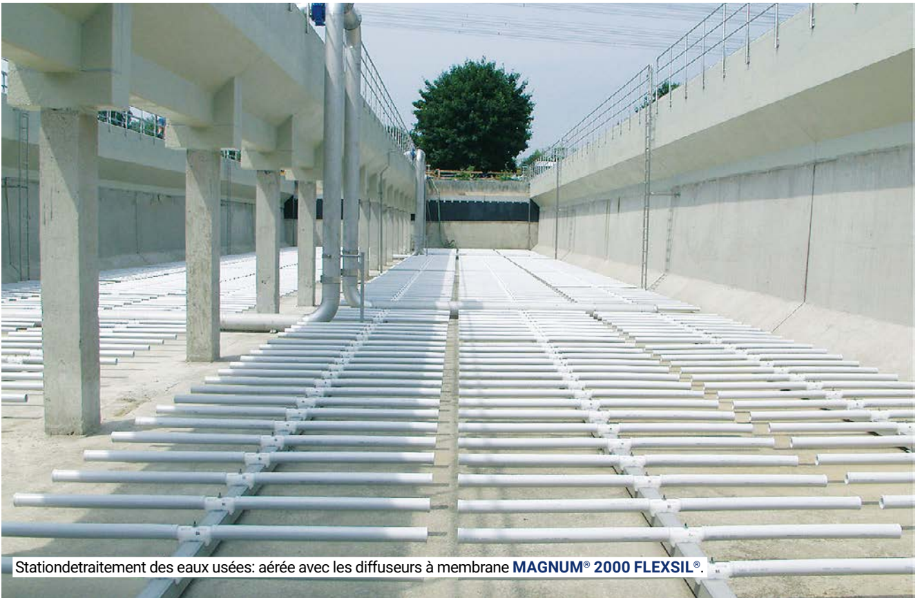
Station de traitement des eaux usées: aérée avec les diffuseurs à membrane MAGNUM® 2000 FLEXIL® .